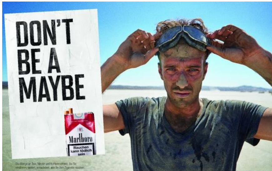
Rauchen kann tödlich sein. Der Rauch einer Zigarette dieser Marke enthält 10 mg Teer, 0,8 mg Nikotin und 10 mg Kohlenmonoxid. (Durchschnittswerte nach ISO)